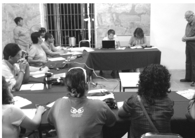
Aspectos del seminario.

en un espacio de resistencia como la escuela, desde fines del siglo XIX hasta el nacionalismo cultural posrevolucionario. 3