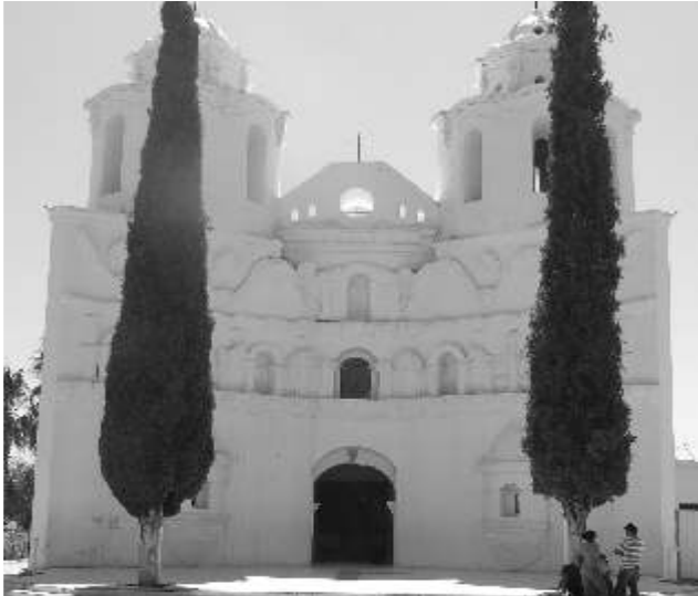
Templo de Bacadéhuachi, Sonora