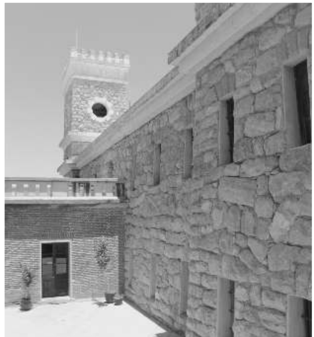
Acceso a oficinas