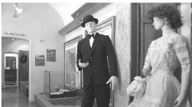
Aspectos interiores del Museo