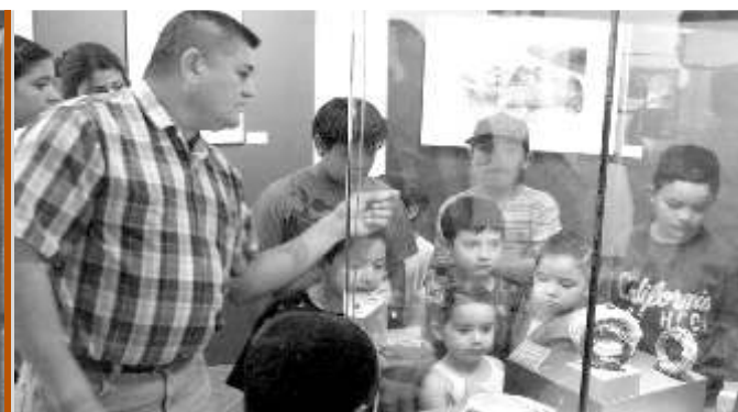
Talleres de verano 2010

El Museo es un buen ejemplo de los resultados que se obtienen entre la colaboración del Gobierno del Estado con las instituciones académicas, en este caso el Instituto Nacional de Antropología e Historia.