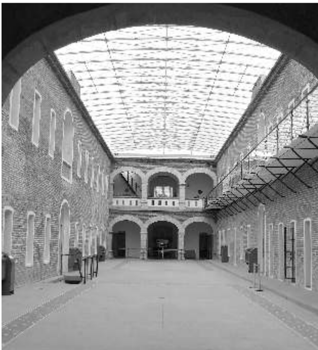
Patio central Museo de Sonora 2010

Los visitantes conocen las etapas del desarrollo histórico de Sonora y los principales hitos de su historia que este año estamos celebrando, como son los procesos de la Independencia y la Revolución Mexicana que nos han dado la patria de la cual gozamos. Te esperamos y nuestro personal especializado te atenderá individualmente o en grupo.