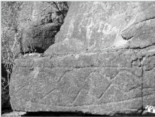
Panel principal del sitio "El Ojito"

CÉSAR A. QUIJADA LÓPEZ/ TOMÁS PÉREZ REYES