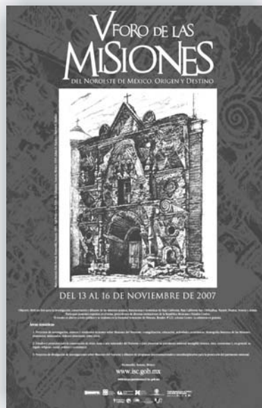
Cartel del V Foro de las Misiones