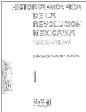
Portada de libro: Archivo Casasola: Historia gráfica de la revolución mexicana