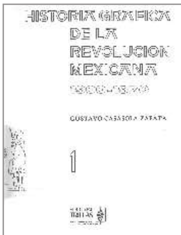
Portada de libro: Archivo Casasola: Historia gráfica de la revolución mexicana