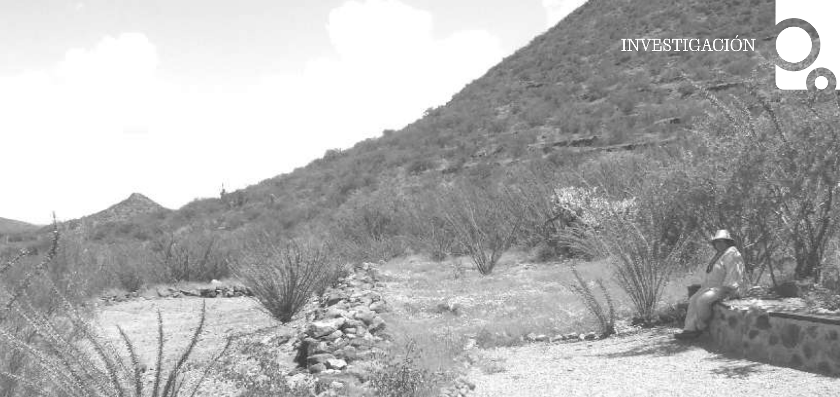
Área de descanso frente a “La Cancha” a principio del recorrido.