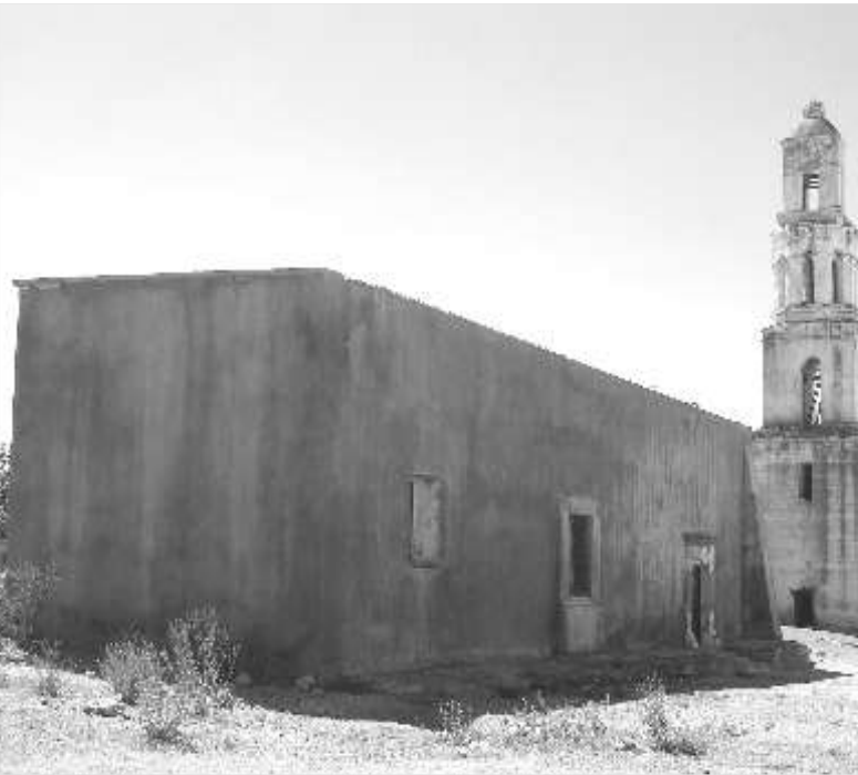
Parte del templo que sufrió daños, correspondiente a la nave antigua.

Colaboradores: Alejandro Aguilar, César Quijada, Esperanza Donjuan y Felipe Mora.