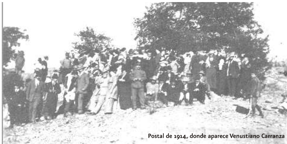
Postal de 1914, donde aparece Venustiano Carranza

La colaboración de hoy es la primera de una serie de información sobre la Revolución en Sonora, que éste Centro estará abordando acorde a los festejos del bicentenario de la Independencia de México y el centenario de la Revolución Mexicana.