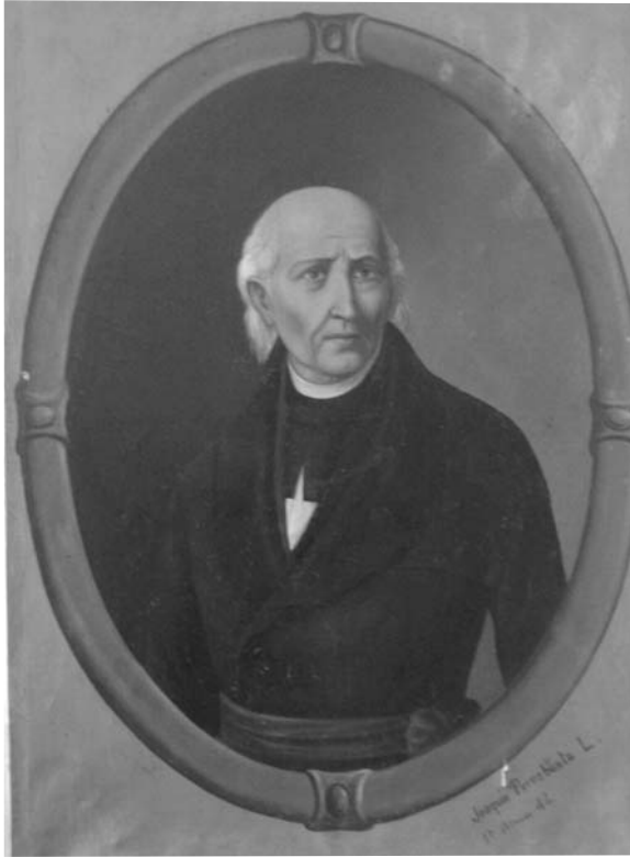
Pintura antes de la restauración