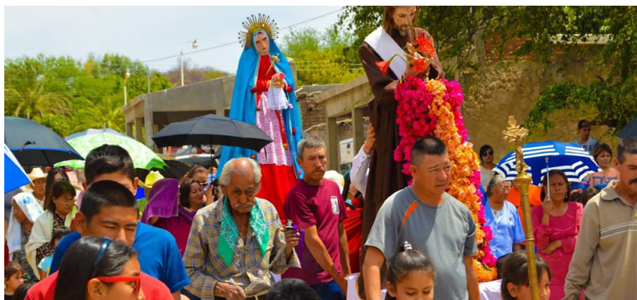
PROCESIÓN "EL SANTO ENTIERRO" EN ÓNAVAS, SONORA.

Cuidémonos y preservemos el patrimonio cultural en beneficio de la sociedad actual y la del porvenir, quien merece gozar de este legado.