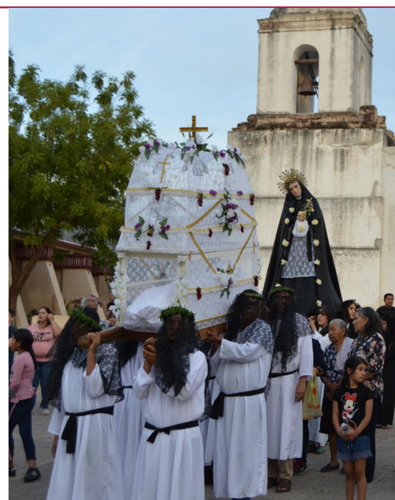
PROCESIÓN "EL ENCUENTRO" EN ÓNAVAS, SONORA.