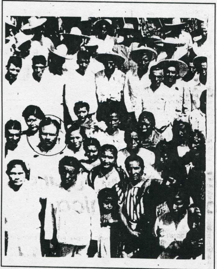
Iban muy bien disfrazados, los malditos asesinos eran soldados de línea vestidos de campesinos.

La primera parte de la lucha jaramillista que podríamos situar de 1938 hasta el término del primer levantamiento, fines de 1944, es la erapa de las percepciones, las mujeres escuchan, oyen, perciben las noticias, los rumores. Pero hay algunas que no están conformes, se inquietan, surgen sus dudas ¿será?. En esta primera etapa hay mujeres cerca de él, sobre todo de la zona (Tlaquiltenango, Jajutta y el Higuerón) que lo conocen y estiman, algunas porque es su vecino, otras por-