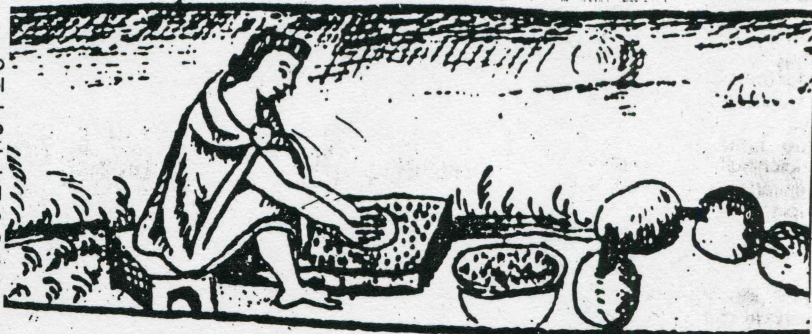
de Sahagún, op cit. f. 204)

Las variedades de chalchihuite consignadas por el Códice