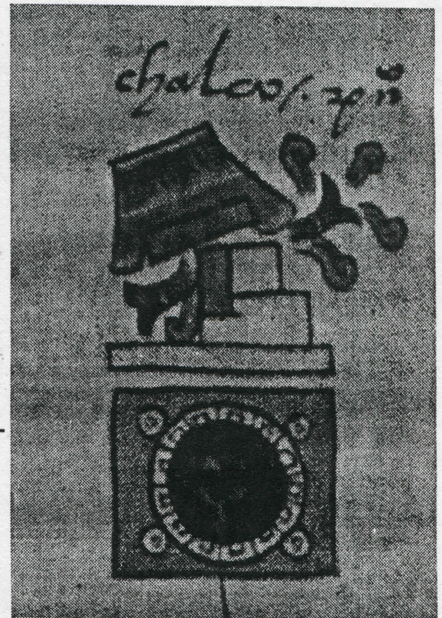
Detalle de la lámina IV del Códice Mendoza en donde el jeroglífico de Chalco es un disco cuyos colores verde, rojo y blanco de las plumas, dan el significado de jade: chalchihuitl, y de ahí el nombre de Chalco: lugar de jade o lugar precioso.