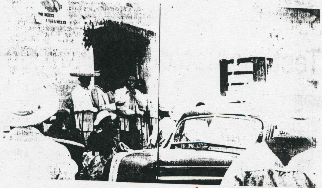
Campeño zapatista, obrero de labranza; ya está sonando el clarín, pa' que tomes tu venganza.

No como otros que anda parandose el cuello que ellos lo pidieron, no, lo pl-