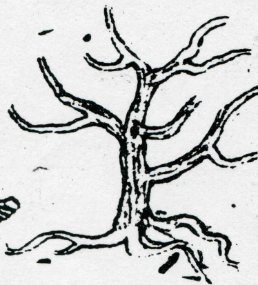
Códice Florentino, Vol. III

CONOCIDO CON EL NOMBRE DE TEMAZCAL, QUE CONSISTÍA EN UN BAÑO CON PLANTAS MEDICINALES. CONOCÍAN ADEMÁS EL USO Y EFECTOS DE LOS ANESTÉSICOS EMPLEADOS DURANTE LAS INTERVENCIONES QUIRÚRGICAS.