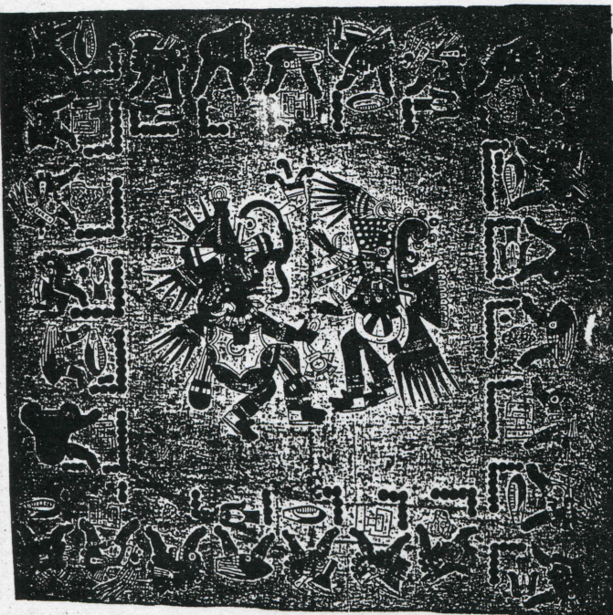
Cuenta calendárica del Códice Borbónico