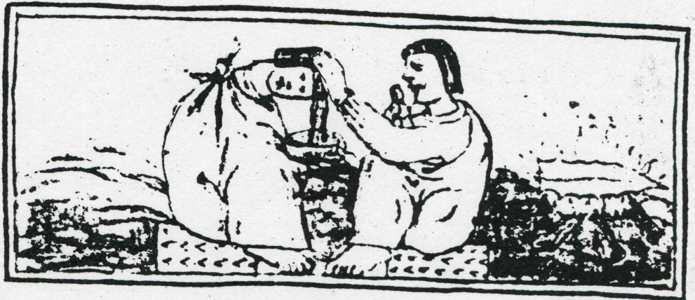
Códice Florentino, Vol. III

COMO OTROS GRUPOS DE ARTESANOS, LOS MEDICOS TENIAN TAMBIEN SUS DEIDADES PROTECTORAS. UNA DE ELLAS ERA TOCI, LA MADRE DE LOS DIOS, DIOSA DE LAS MEDICINAS Y DE LOS TEMAZCALES Y PATRONA DE LOS MEDICOS, SANGRADORES, PARTERAS Y CIRUJANOS. DURANTE SU FESTIVIDAD, QUE TENIA LUGAR EN EL UNDECIMO MES LLAMADO OCHPANIZTLI, ENTRE OTROS RITOS, ACOSTUMBRABAN BARRER Y HACER