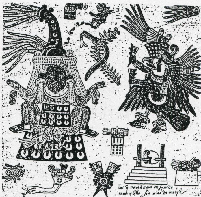
— Sacerdote Xipe vestido con la piel de una víctima (Códice Borbónico)

podemos ver que en el tiempo que corresponde mas o menos al de Marzo, se festejaba en el mundo mexica la festividad de Tlacaxipehualtzil, dedicada al dios de Xipe Totec. En esta ceremonia se sacrificaban los prisioneros que después de muertos, los arrojaban los sacerdotes por las escaleras del templo, y al llegar al patio, tomaban los cuerpos; los desollaban y entregaban a sus dueños, quienes los comían con sus convidados. Con los pellejos de las víctimas se vestían unos sacerdotes, se ponían encima los adornos y salían a las calles a simular luchas con algunos de los guerreros, y así andaban varios días hasta queapestaban los pellejos de