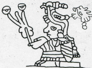
Sacerdotes-astrónomos (códice Bodley-tomado de Broda, J. 1992).