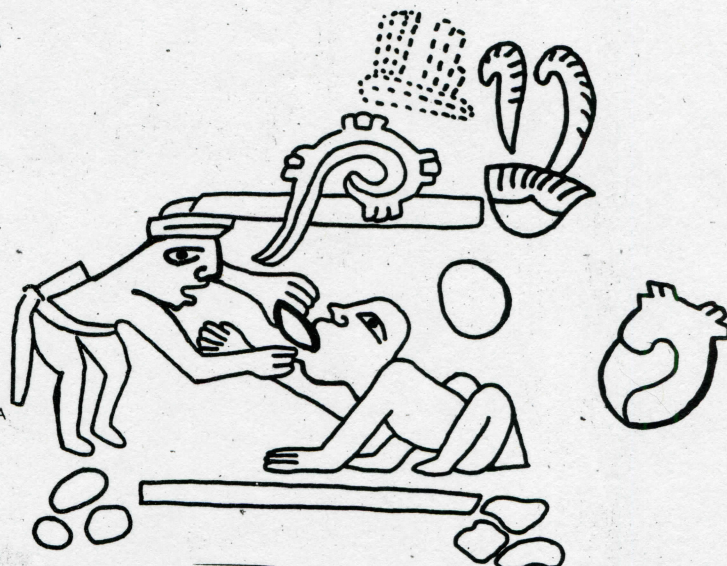
Fragmento del mural "La ciencia médica", descubierto en Tepantitla, Teotihuacán, Mex.

EN EL OFICIO DE CURAR EXISTÍAN ESPECIALIDADES, PERO TODOS LOS MÉDICOS PERTENECÍAN AL MISMO GREMIO. TODOS UTILIZABAN EL RECURSO TERAPÉUTICO Y RITUAL