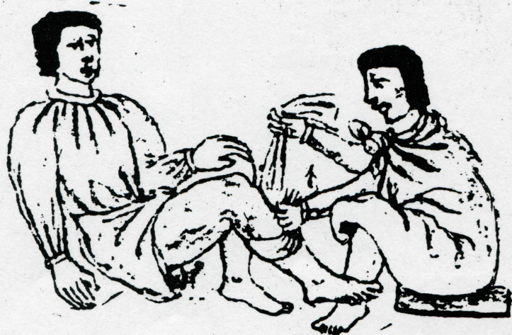
Códice Florentino, Vol. III