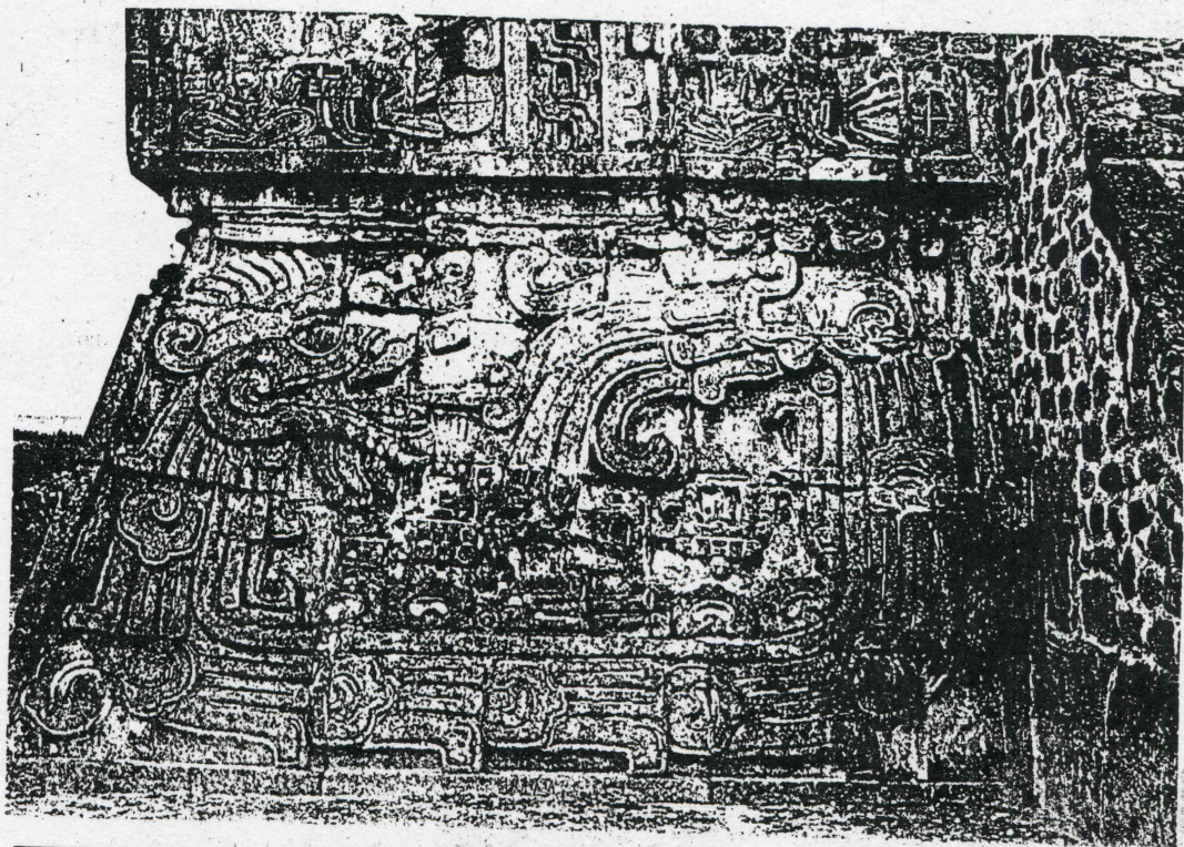
Xochicalco, Mor. Relieve que muestra una corrección calendárica.

La siguiente observación corresponde al lugar donde supuestamente uno debe acudir