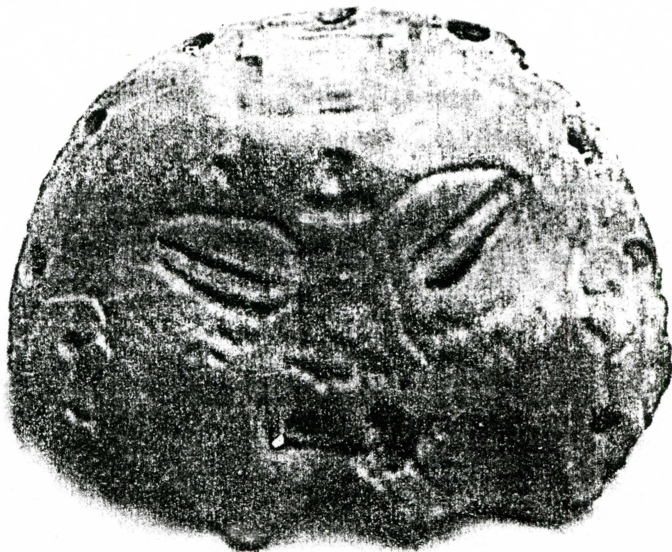
Recipiente elaborados con huesos de animal

otras áreas de mesoamérica, la materia prima utilizada fueron huesos humanos, astas, cuernos y huesos de animal. Con estos materiales se elaboraron punzones, agujas, bruñidores, cuentas, instrumentos musicales, máscaras y recipientes. La función de dichos artefactos fue diferente, ya que unos fueron usados como elementos decorativos, otros como herramientas de trabajo y algunos estuvieron destinados exclusivamente para fines rituales.