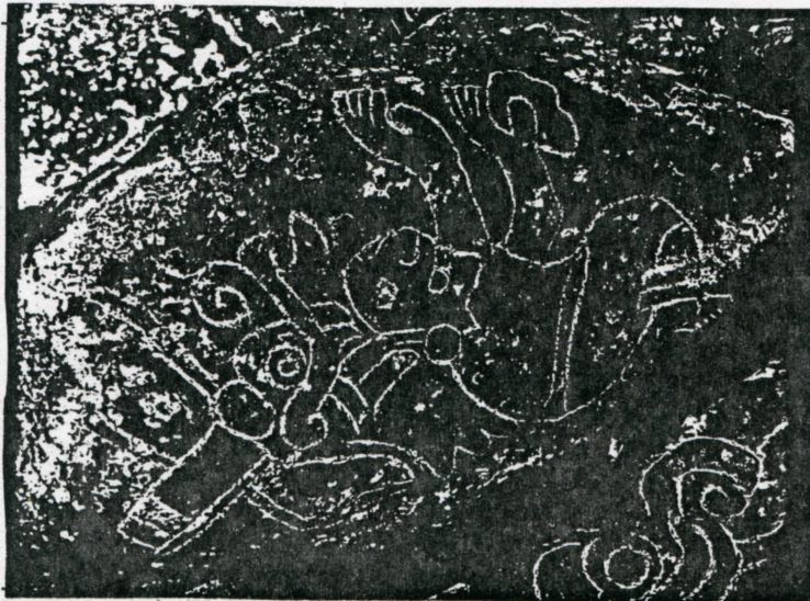
Oxomoco, dibujo de C. A. Robelo

Robelo, una vez finalizadas sus disertaciones concluye afirmando que las figuras representadas en la lámina XXI del Códice Borbónico