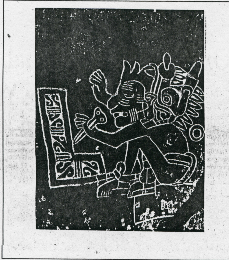
Cipactónal. Dibujo. C. Robelo

hacen referencia al origen del hombre y contrastándolos con los datos arqueológicos de varias ciudades prehispánicas, lo llevan