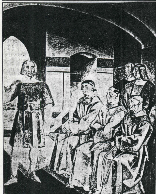
DECIDEN LA evangelización de América.

encabezada por Porfirio Díaz, que lo obligó definitivamente el poder.