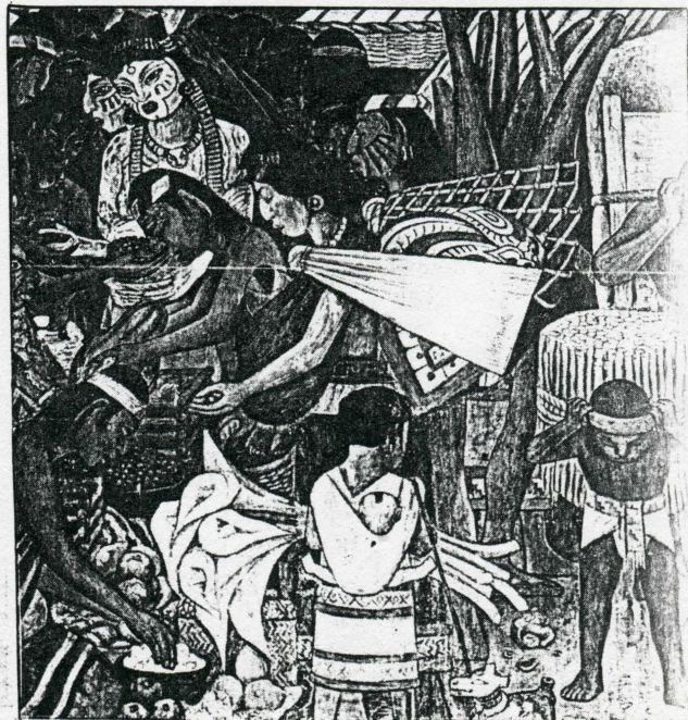
LAS ACTIVIDADES económicas impresionan por su movimiento y cantidad.

estado de Morelos, tratando de crear conciencia a los habitantes del nuevo estado, sobre quien pudiera ser mejor gobernante y menciona "... elevada por fin a la categoría de Estado... se hizo indispensable elegir a nuestros poderes, donde salta a la vista la necesidad de encomendar los principales puestos a hombres capaces de conducirnos también para que éstos puestos no se conviertan en instrumentos políticos con el que se pretenden satisfacer miras siniestras... Se ha buscado el voto de los pueblos para apoyar la candidatura del General Porfirio Díaz. Sus partidarios trataron de colocar como gobernador del estado, al caudillo de Oriente... Sin comprender que bajo su gobierno los espera un porvenir sobrio... Es obvio que estaba rodeado de gran prestigio que había adquirido en la guerra de reforma, que lo hacía a toda luz recomendable, pero que también era cierto, decía que vendría a causar la destrucción del naciente estado, puntualizando que Díaz era digno de ocupar la primera magistratura del país, siempre que llegue legalmente, ésta citando en vez de ayudar al recién nombrado Estado, le va a crear conflictos,