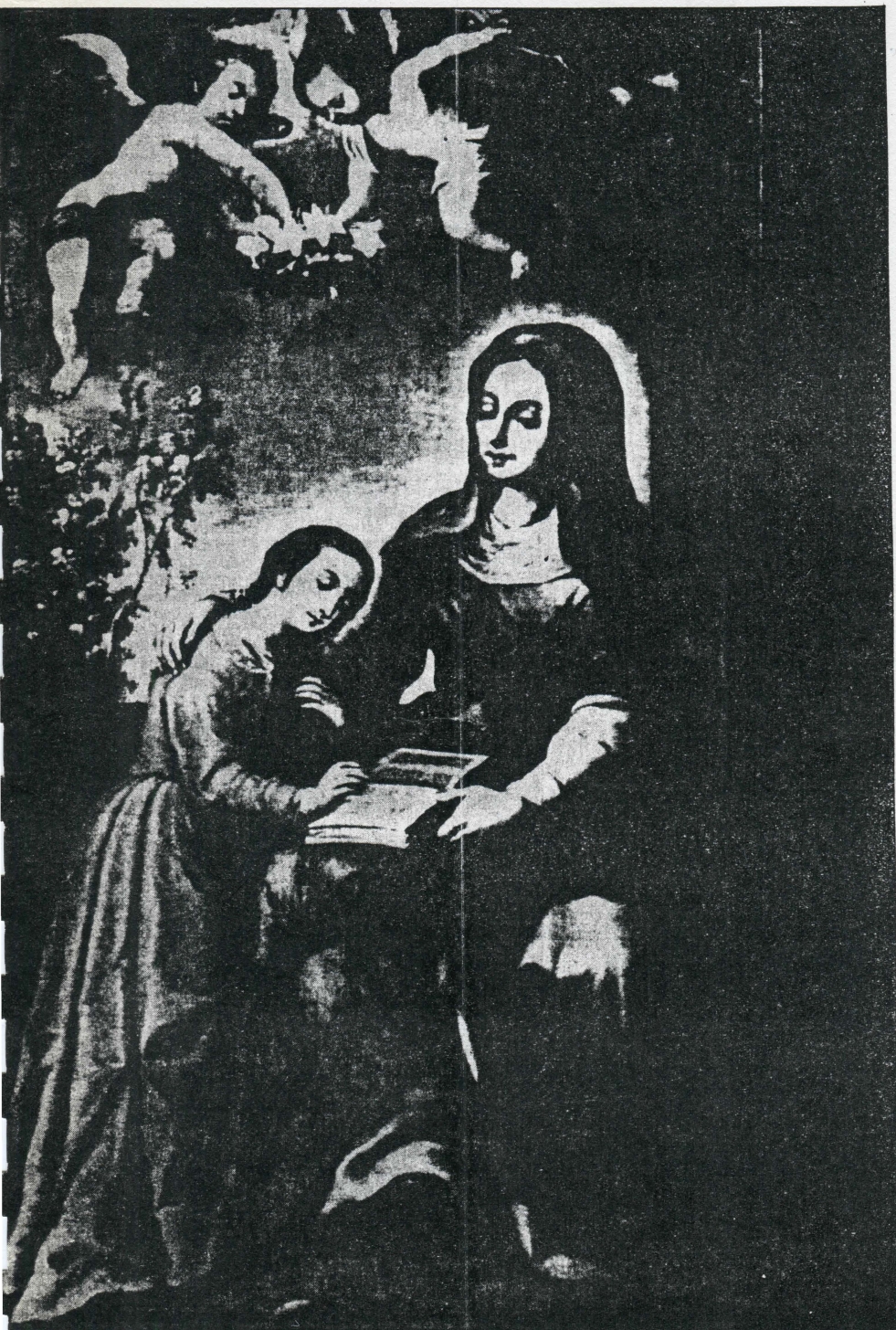
“Santa Ana enseñando a leer a la Virgen” procedencia Catedral de Cuernavaca antes de restauración.