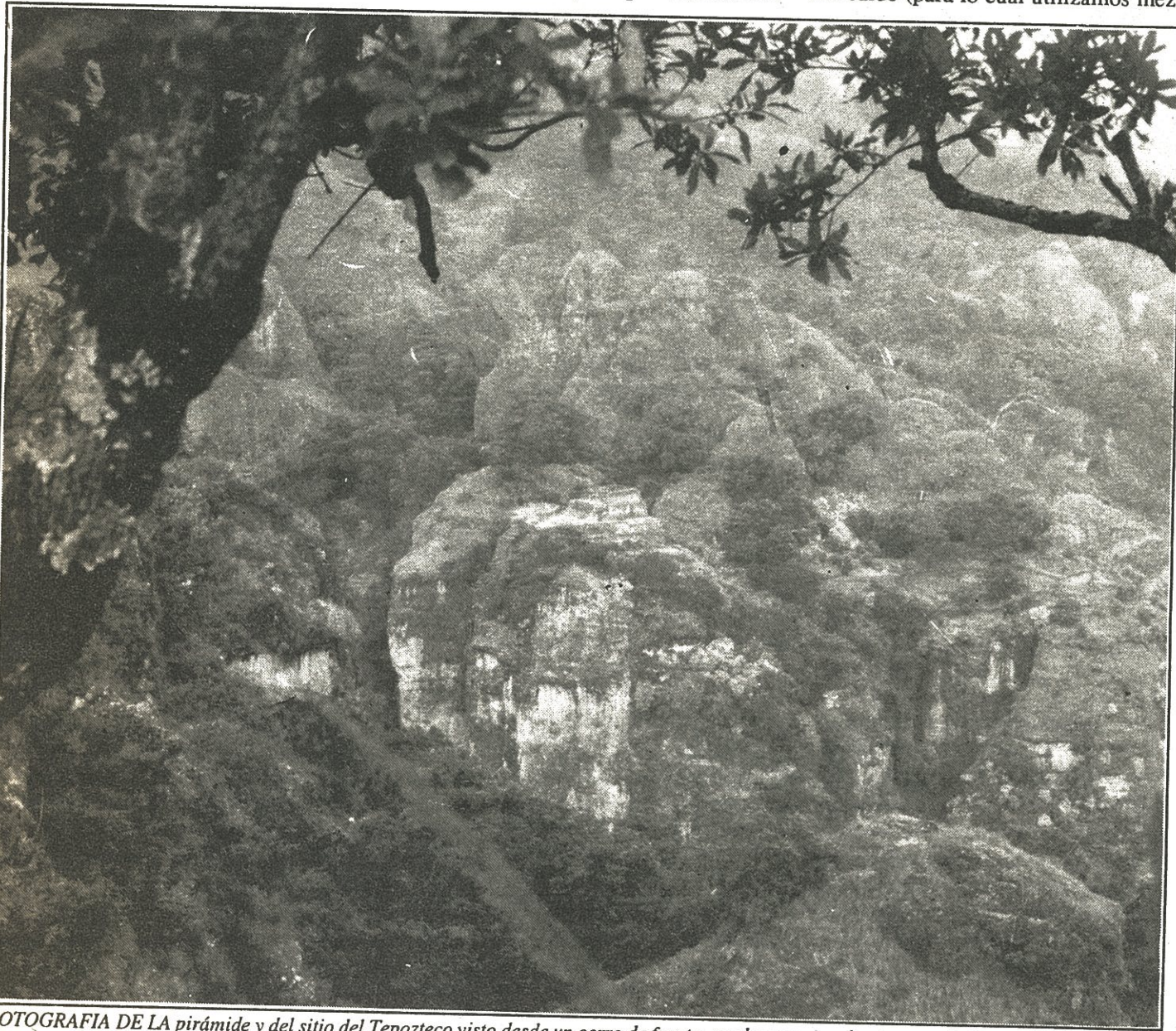
FOTOGRAFIA DE LA pirámide y del sitio del Tepozteco visto desde un cerro de frente; se alcanza a ver las terrazas habitacionales en el este del sitio (las escaleras están orientadas hacia el oeste)