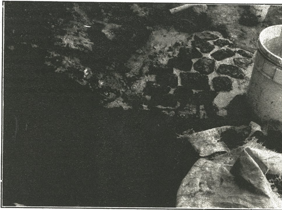
AQUI MOSTRAMOS diferentes etapas del trabajo de relleno de un hueco en uno de los pasillos de la plataforma: en la mezcla de arena, cal y cemento se colocaban pequeñas piedras de tezontle (no pesa) que amarraban la mezcla, al final todavía fresca la mezcla se le ponía tierra, para que oscureciera y no se viera tan blanco

Regularmente en una región dada y ante cierta deficiencia, (canales de comercialización, almacenes, acopio de insumos, transporte, maquinaria, ampliaciones, defensa de sus derechos, etc.) dos o más ejidos deciden