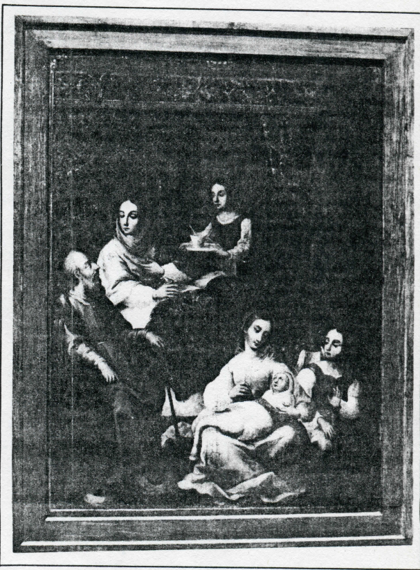
"EL NACIMIENTO DE LA VIRGEN". Se trata de un óleo sobre tela de 1922 x 1.18 metros. Esta pintura se atribuye a Juan Correa y se encuentra en el salón de juntas de la Catedral de Cuernavaca.

reino: el jengibre y drogas locales, el clavo aromático, la cubeta y la nuez moscada.