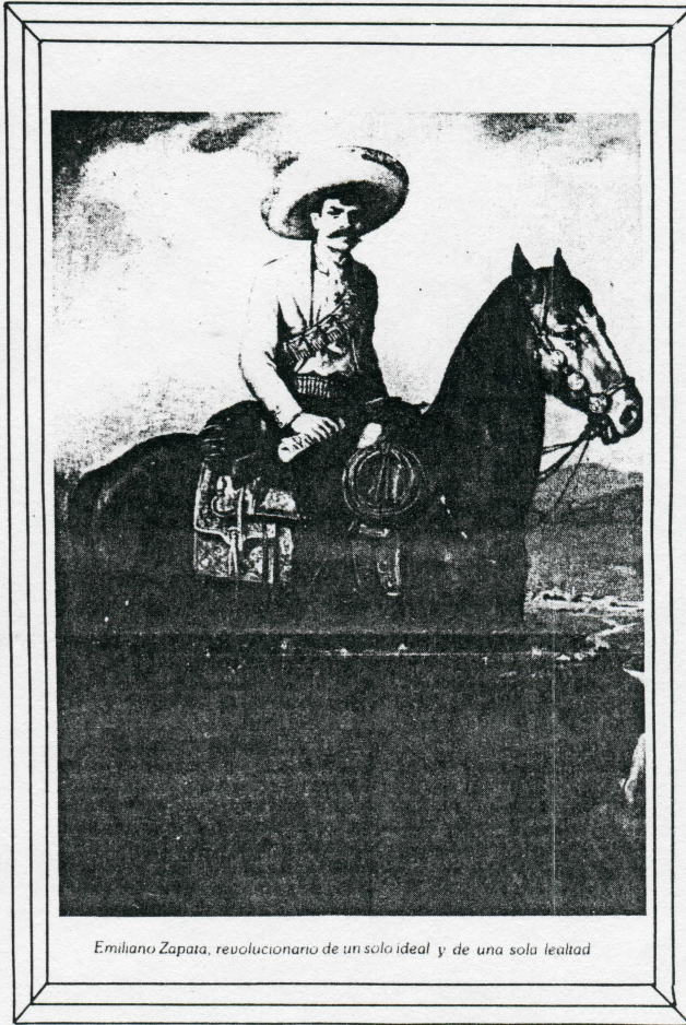
Emiliano Zapata, revolucionario de un solo ideal y de una sola lealtad

Con el fin de asegurar mejor este dominio sobre la población, se llevó a cabo un proceso denominado Congregación. Estas afectaron los patrones de asentamiento prehispánicos, porque ella implicaba una redistribución forzada de la población. Política, que no