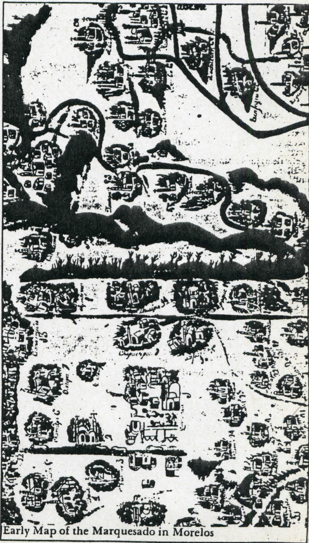
Early Map of the Marquesado in Morelos

Así las cosas, llegó la época de la Revolución y la desaparición de los Poderes Públicos del Estado de Morelos (1913) circunstancia que aprovecharon los habitantes de los poblados limítrofes, principalmente los de Tilzapotla, Morelos, para nombrar funcionarios municipales apoyados abiertamente por las autoridades del Estado de Guerrero, poniendo a esta zona, políticamente, bajo su mando.