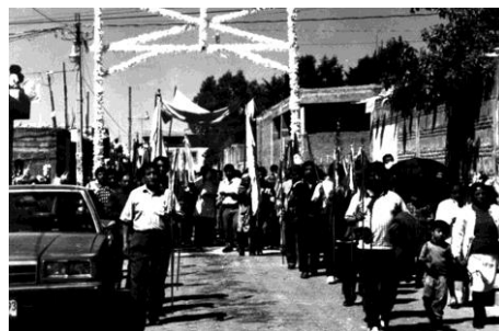
Figura 2. Procesión del santo.

El costo de las mayordomías es sufragado por el mayordomo y sus componentes en relación de que al primero le corresponde el 50% de los gastos y a los componentes el otro 50% dividido entre tres. Como uno de los objetivos particulares de las mayordomías es estar pendiente por la imagen que se venera en la parroquia, entonces cada uno de los que componen la mayordomía van turnándose cada semana para la colocación y pago del arreglo floral.