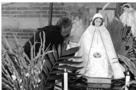
Figura 3. Visita a La Virgen María en la casa del mayordomo.

En la comunidad, la fiesta inicia en los primeros días del mes de octubre, cuando el mayordomo de San José, en compañía de su familia local y extensa, asiste a la casa del mayordomo de La Virgen María, quien también se hace acompañar de su familia local y extensa, y del fiscal del barrio (Figura 3). El primero lleva consigo flores, incienso y un canasto con pan. Una vez que han llegado a la casa en cuestión, solicitan permiso para la entrega de los regalos. Entonces, el fiscal, delante de la imagen de La Virgen, solicita permiso para que el mayordomo de San José adorne su nicho.