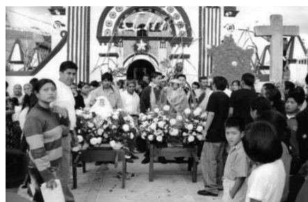
Figura 5. La imágenes de La Virgen María y San José presentadas en la capilla.

Cuando han llegado a la capilla, ambas imágenes son colocadas a un lado del altar y los padrinos enfrente de ellas. Concluye la misa y entonces las imágenes son sacadas al atrio para que nuevamente sean cargadas y llevadas en