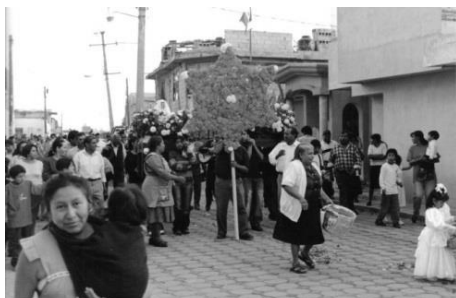
Figura 4. La procesión con el Xochitelpoch al frente.

ramos de Cempoalxochitl, mismos que adornarán la puerta de la casa. Mientras tanto, en la casa del mayordomo de San José, la familia se encuentra preparando la comida para después de la misa. Las mujeres se encargan de la cocina, mientras que los hombres ponen mesas y adorman el frente de la casa y la capilla del barrio.