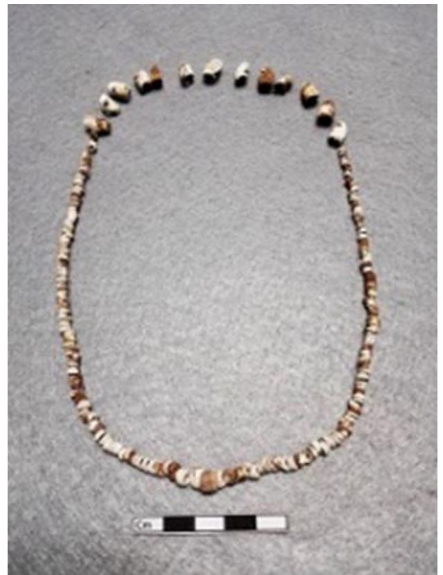
Figura 6.- Atavío de 236 concha de la especie Olivella Sp. y Spondylus Principes .