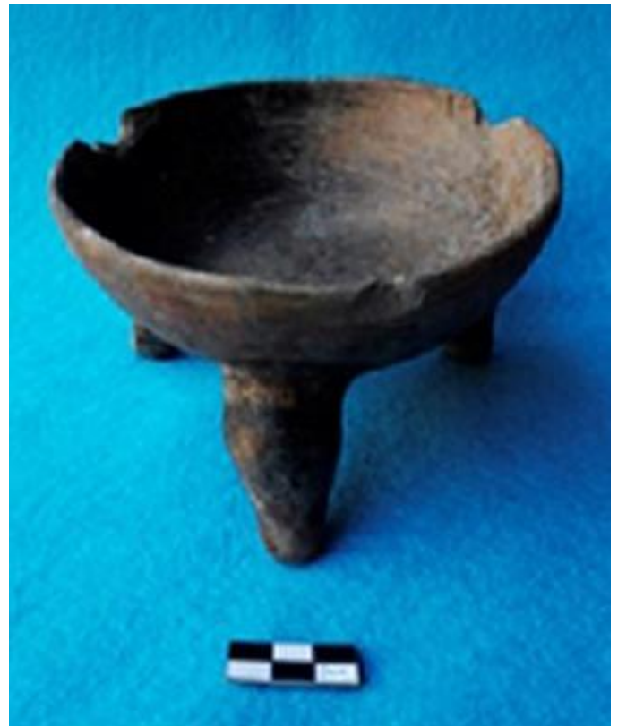
Figura 9.- Molcajete Manuelito Café liso.

ritual debido al espacio tan pequeño excavado y además a las alteraciones en el subsuelo, por lo que este tema plantea una de tantas incógnitas más acerca de este periodo.