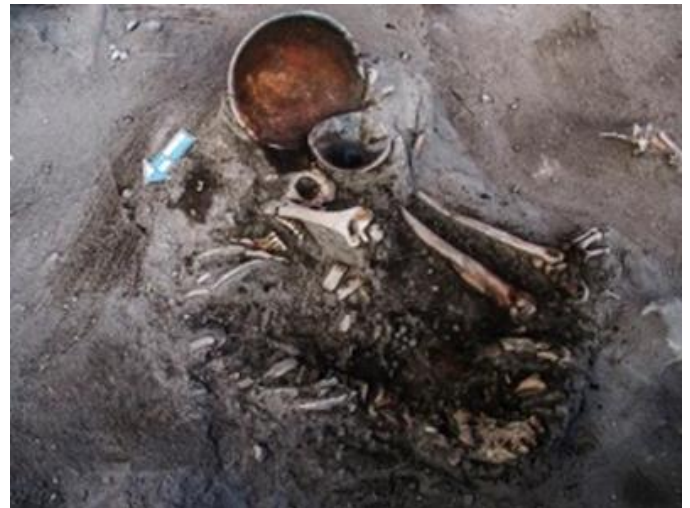
Figura 5.- Entierro 7.

Asimismo, este individuo tenía un collar de más de doscientas cuentas de concha, ojivas miniaturas no mayores a un centímetro en el área de las cervicales y en el pecho varias cuentas con un corte transversal y perforación bicónica.