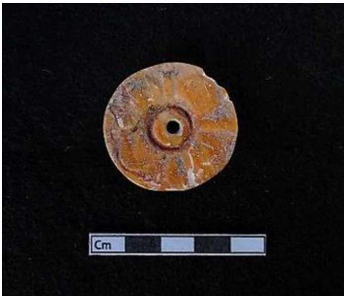
Figura 3.- Ofrenda Entierro 4, diseño de flor de cuatro pétalos.