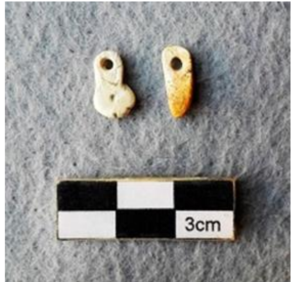
Figura 2.- Atavío mortuario del Entierro 1.

que se sugiere que fueron utilizados en las orejas del individuo.