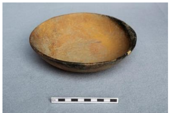
Figura 10.- Cajete cóncavo divergente, tipo Mazapa no identificado Pulido en Patrón.