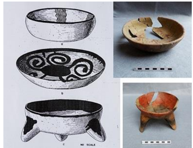
Figura 8.- Retomado de Koehler, 1960, izquierda tipos cerámicos diagnósticos del Complejo Mazapa: a) Mazapa Líneas ondulantes; b) Tolteca Rojo sobre Bayo, c) Macana Rojo sobre café. Derecha superior Cajete Tolteca Rojo sobre Bayo, Ofrenda Entierro 1, inferior Macana Rojo sobre Café, ofrenda Entierro 7.

McCullough sugiere que hay tres tipos diagnósticos para definir el Complejo Mazapa, éstos son: Mazapa Rojo sobre Café (Mazapa Líneas ondulantes), Macana Rojo sobre Café (Wide Band Red on Buff) y Tolteca Rojo sobre Bayo (Toltec Red on Buff), sumado a ello, sugiere que sería posible encontrar algunos tientos Jara Anaranjado Pulido, que Koelher llama Polished Orange y Proa Crema Pulido o Polished White . 12