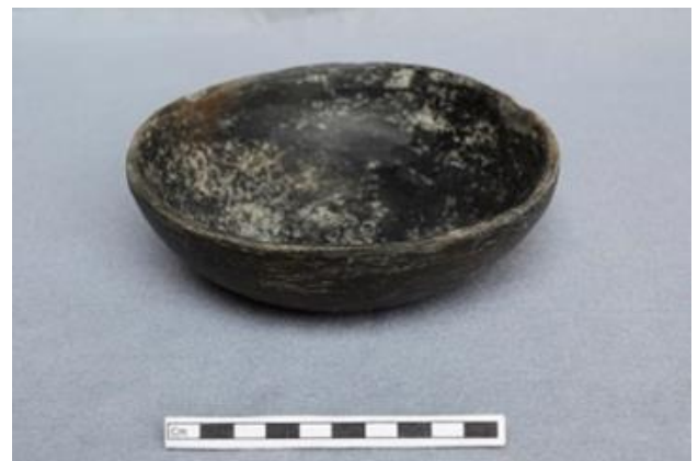
Figura 4.- Cajete cóncavo divergente del tipo Tolteca Café, ofrenda Entierro 6.

Presentó una ofrenda de un cajete de paredes cóncavo divergente del tipo Tolteca Café, localizado a la altura de la pelvis. Como el caso del resto de los individuos identificamos una serie de rocas tanto alrededor como en la parte superior del individuo constituyendo un sistema funerario consistente con el resto de los individuos.