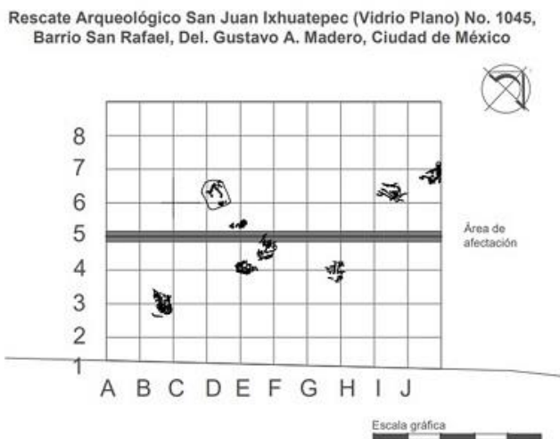
Figura 7.- Planta general de la distribución de los entierros.

El proceso de excavación permitió reconocer algunos restos de fibras vegetales que se localizaban en la matriz, mismo sitio donde fue posible recuperar cuentas miniatura de cerámica de 1 mm a 3 mm de diámetro con perforación tubular que posiblemente estaban cosidas a la prenda con la que fue sepultado el individuo. Al levantar los restos óseos, específicamente el cráneo se logró recuperar un pendiente circular de piedra verde con dos perforaciones bicónicas.