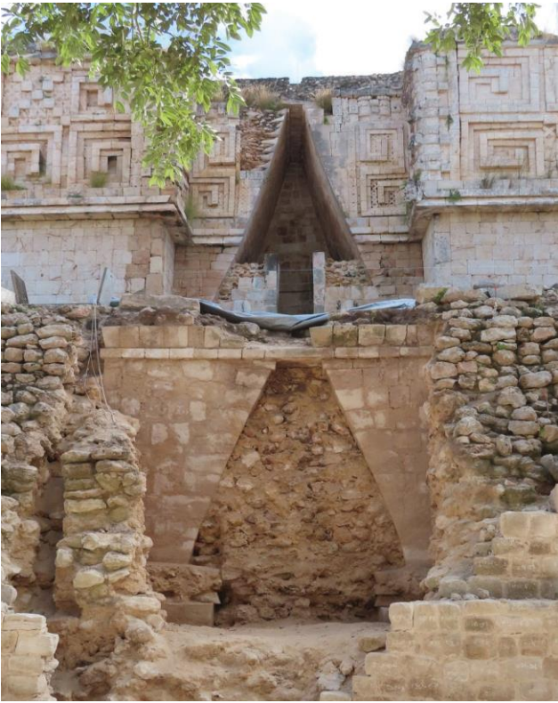
Figura 2.- Fotografía del arco oriente.

postura se encontraba el Proyecto Uxmal, dirigido por el arqueólogo Huchim, que en las exploraciones realizadas en los años noventa consiguió información por la cual sugería que tanto el Palacio del Gobernador como el Cuadrángulo de las Monjas existían antes de la ocupación de los Itzaes y sólo fueron remodelados por éstos. Sin embargo, las evidencias eran escasas hasta el descubrimiento de la subestructura del Palacio del Gobernador, que indica que los volúmenes constructivos fueron obra de los mayas del Puuc. Este descubrimiento, también ha permitido conocer la forma inicial del edificio, que originalmente consistía en tres construcciones independientes, cada una en su propia plataforma.