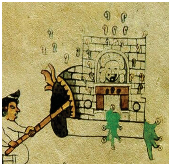
Figura 2.- Temazcal en el que se pueden ver sus diferentes componentes arquitectónicos, así como la cabeza de la deidad Temazcalteci, Códice Tudela , f. 62.

recién paridas, para que sanen y para purificar la leche [...] los que tienen nervios encogidos, y también los que se purgan, después de purgados; también para los que caen de su pie o de alto, o fueron apaleados o maltratados, y se les encogieron los nervios; también aprovecha a los sarnosos y bubosos, allí los lavan. 4