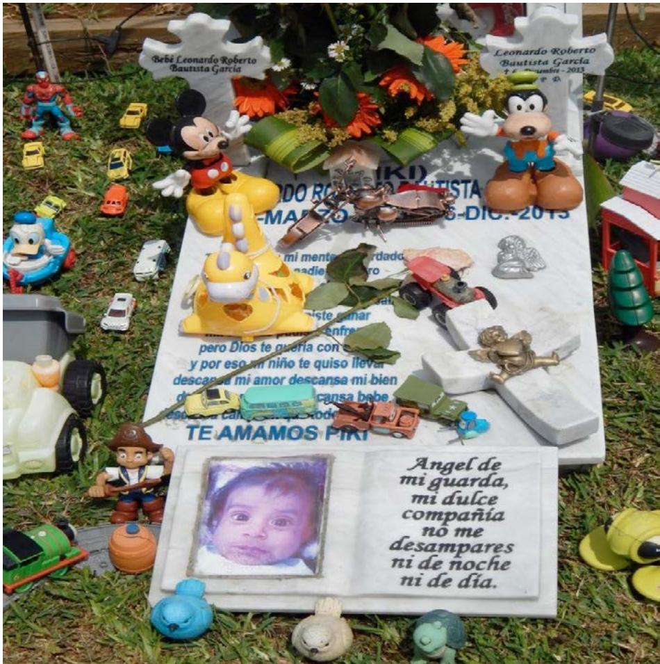
Figura 7 Caso 2

frentó a una dura enfermedad de la cual no se salvó, de modo que su padre le desea que por fin descanse en paz. De esta forma los padres revelan un poco acerca de la causa de muerte de su bebé.