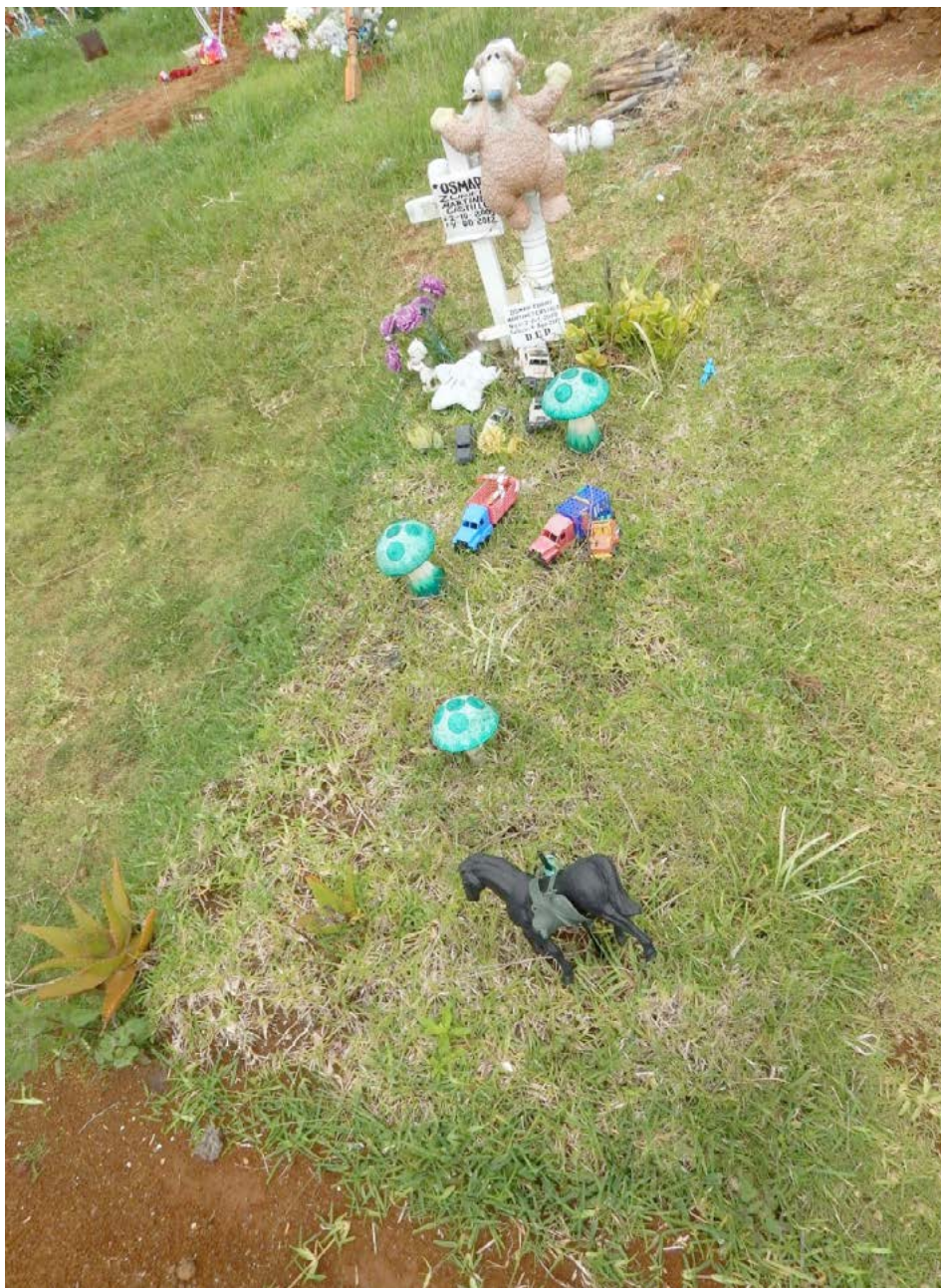
Figura 12 Caso 4