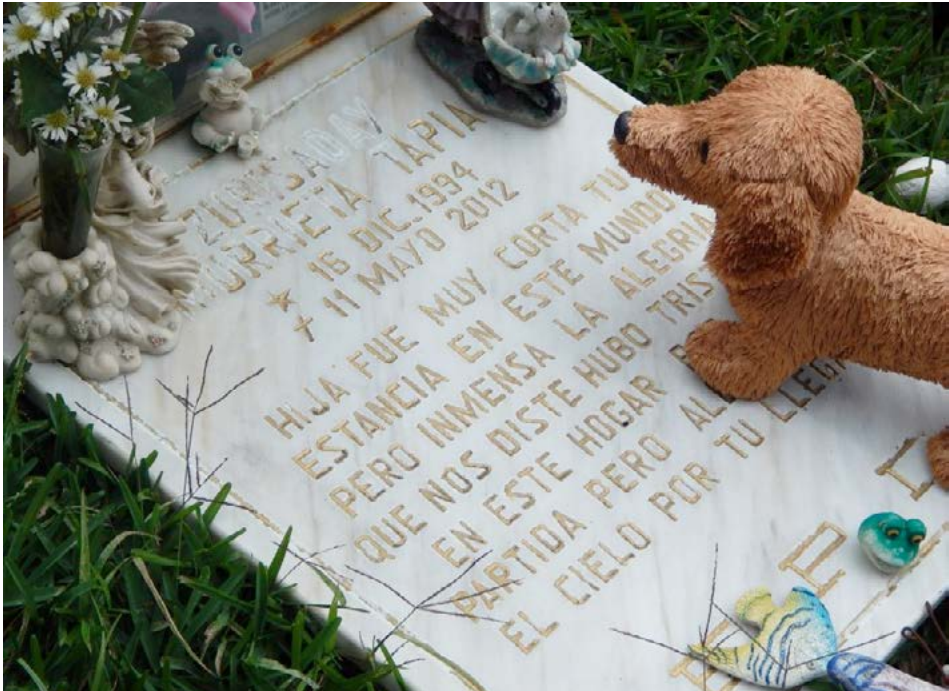
Figura 2 Caso 1

mausoleo hay una cruz de madera con el nombre de la difunta, la fecha de nacimiento y la de muerte. Además se observa la siguiente cita bíblica: “Yo soy la resurrección y la vida. Quien crea en mí, aunque muera, vivirá”.