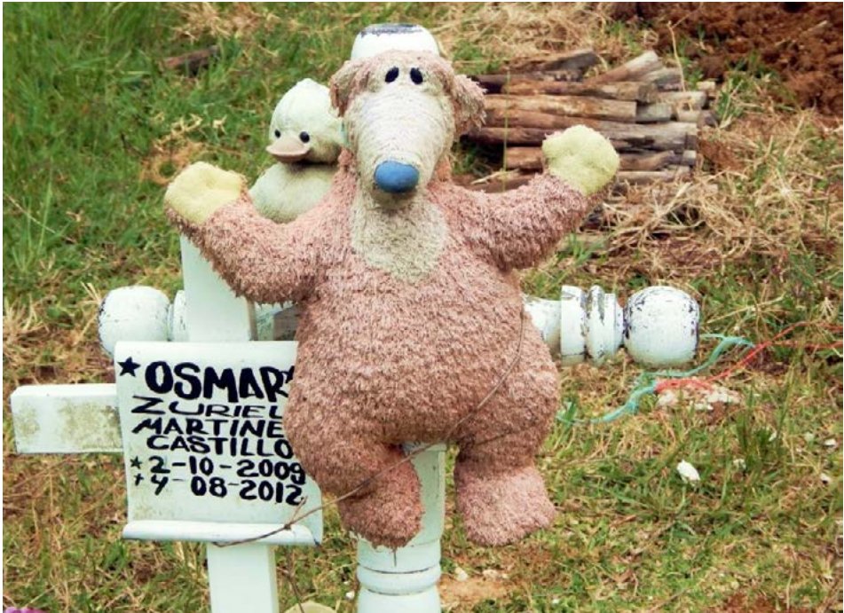
Figura 15 Caso 4

dad, como el Power Ranger, que pertenece a un programa televisivo dirigido a los chicos. Por otro lado, los peluches del pato y el oso atados a las cruces blancas representan el lado infantil: la protección maternal. El oso es símbolo de cariño y protección, una especie de compañía que no abraza un nombre grabado en una cruz, sino al propio difunto.