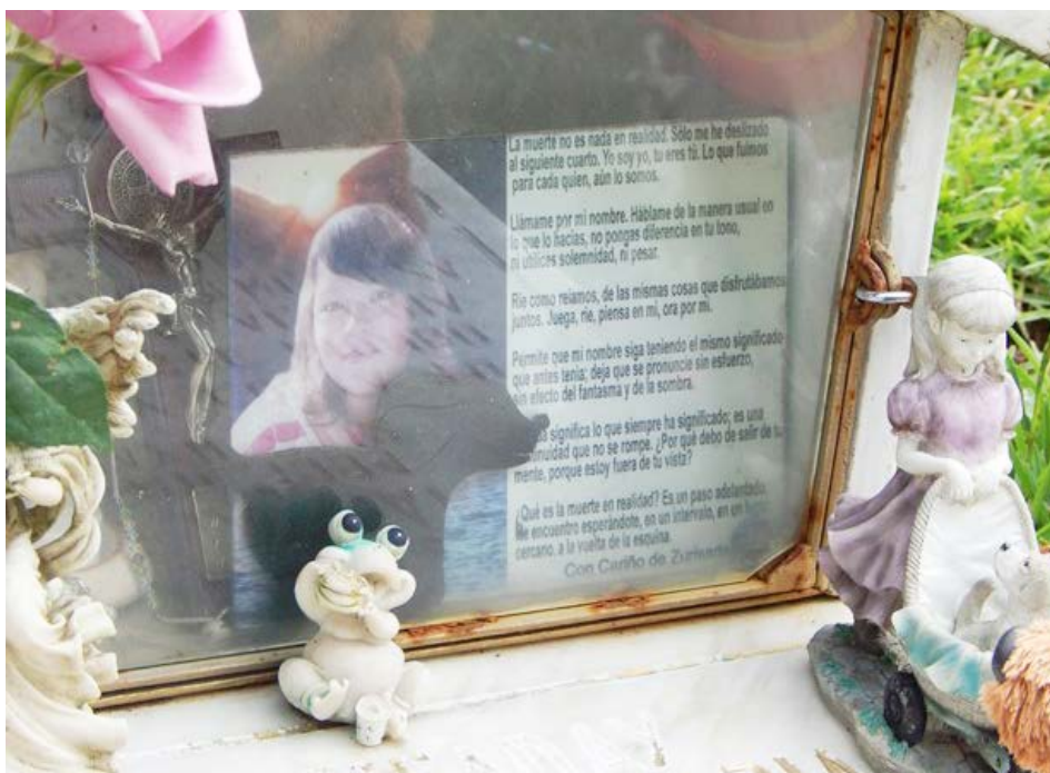
Figura 3 Caso 1

Ríe como reíamos, de las mismas cosas que disfrutábamos juntos. Juega, ríe, piensa en mí, ora por mí.