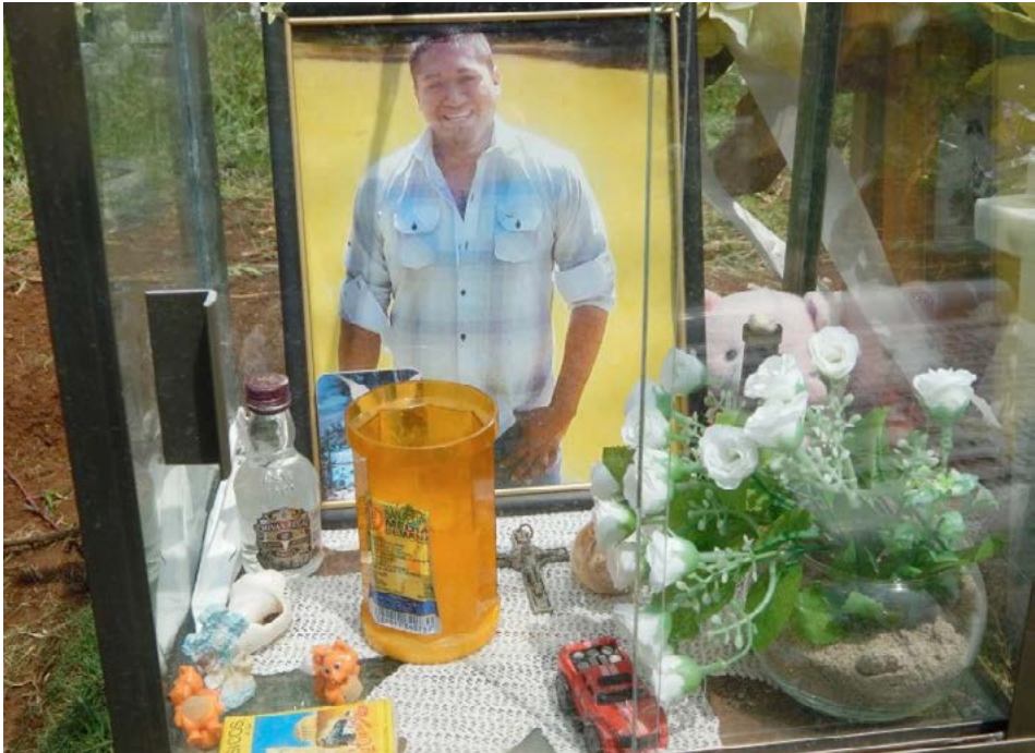
Figura 10 Caso 3