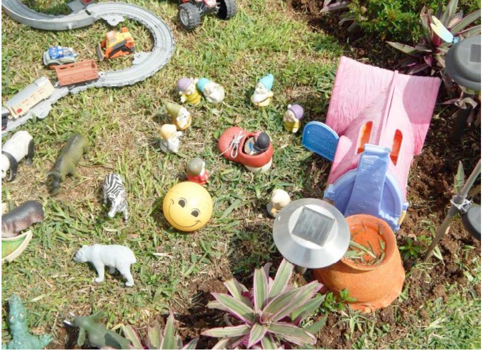
Figura 6 Caso 2

dos pajaritos, una tortuga y un caracol. Del lado izquierdo de la tumba, dos hongos, y del lado derecho, una maceta. Del lado derecho superior, un enorme rehilete de colores.