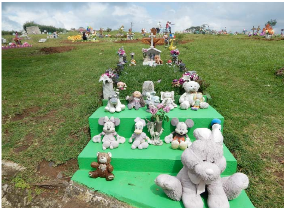
Figura 1 Caso 1