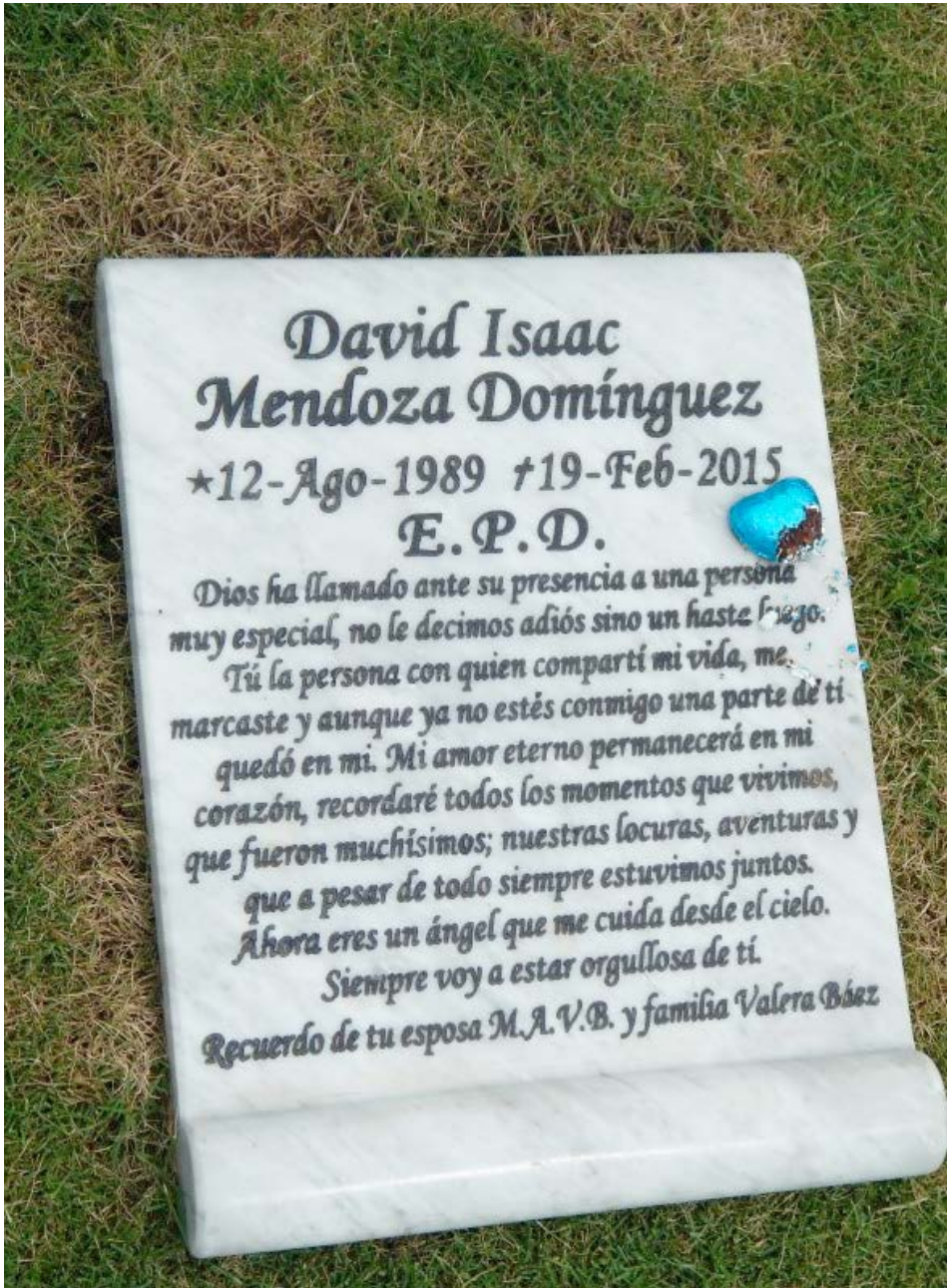
Figura 9 Caso 3