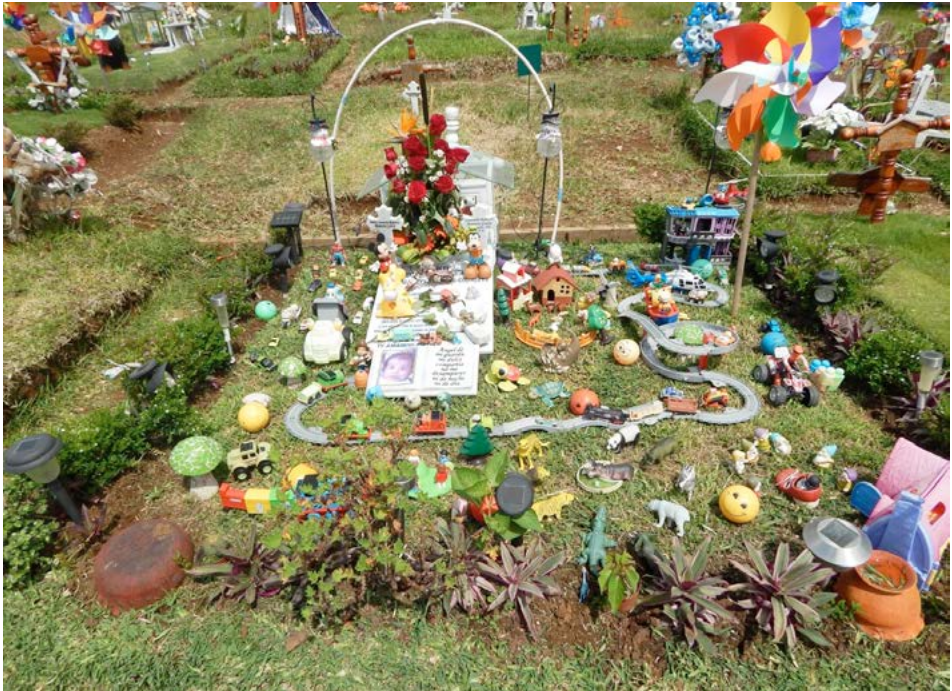
Figura 4 Caso 2

Especificaciones de la lápida: pertenece a un bebé que vivió nueve meses.