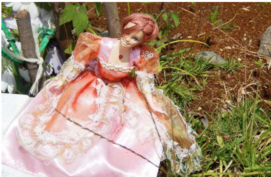
Figura 17 Caso 5

la con cariño en la Tierra. En cuanto a los objetos sobre el sepulcro, resulta evidente que la muñeca Barbie no es un juguete que la bebé haya usado. Las muñecas de este tipo se relacionan con la etapa infantil de las niñas, como un símbolo de su feminidad –incluso está vestida de rosa–. Por otro lado, la flor blanca, al ser la única, y tomando en cuenta que en el epitafio nombran a la bebé un “ángel”, considero que tiene que ver con la pureza: la blancura de un ser que no conoció la maldad.