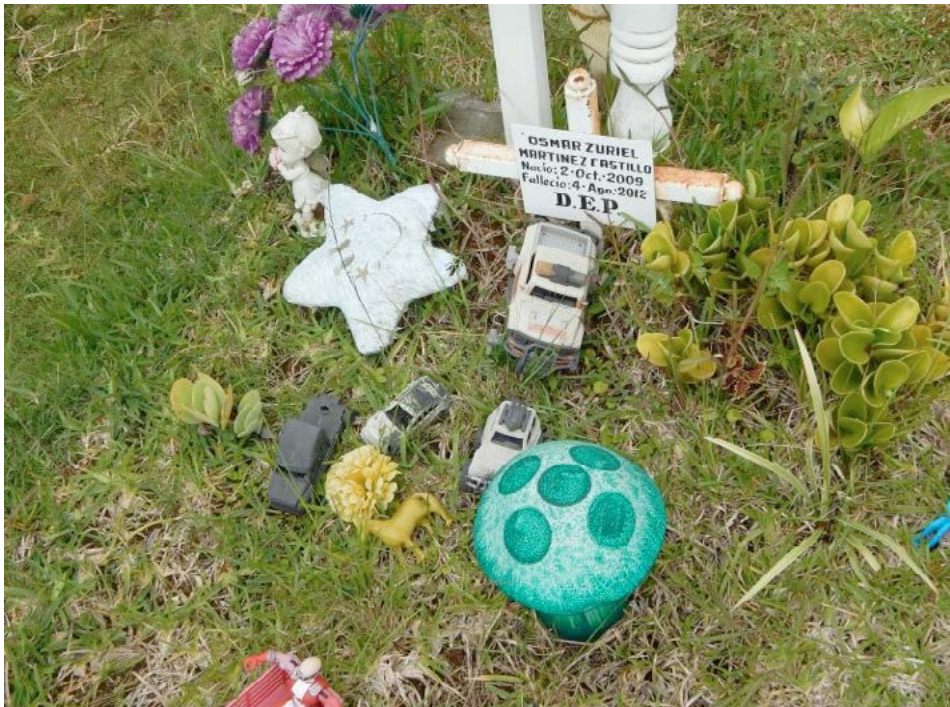
Figura 14 Caso 4