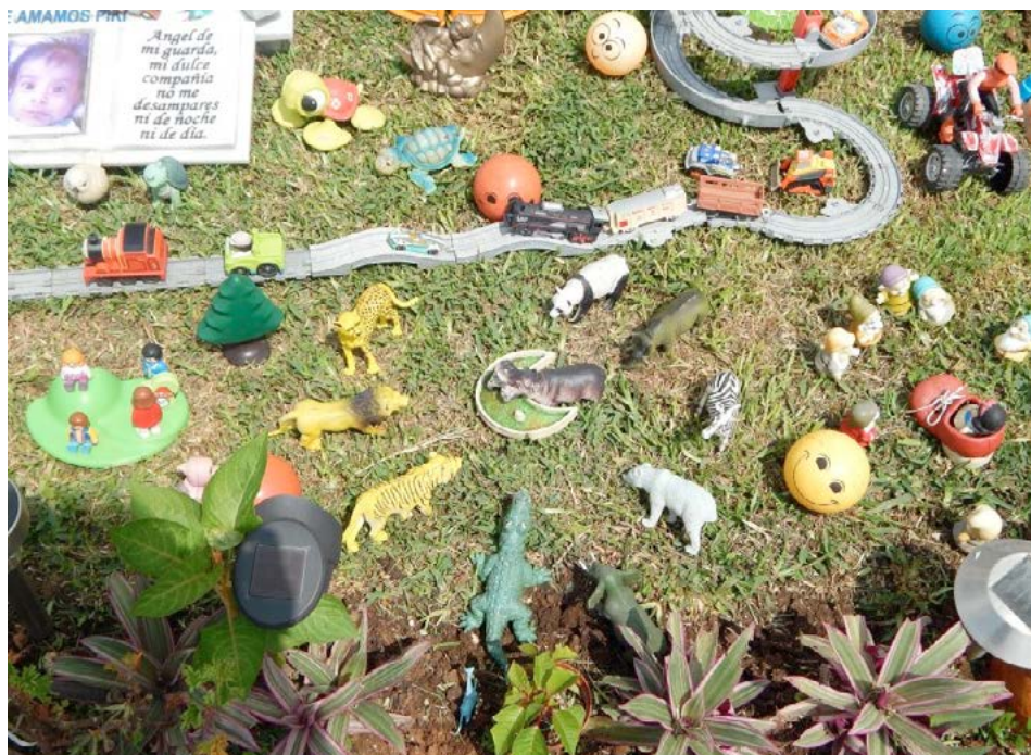
Figura 5 Caso 2