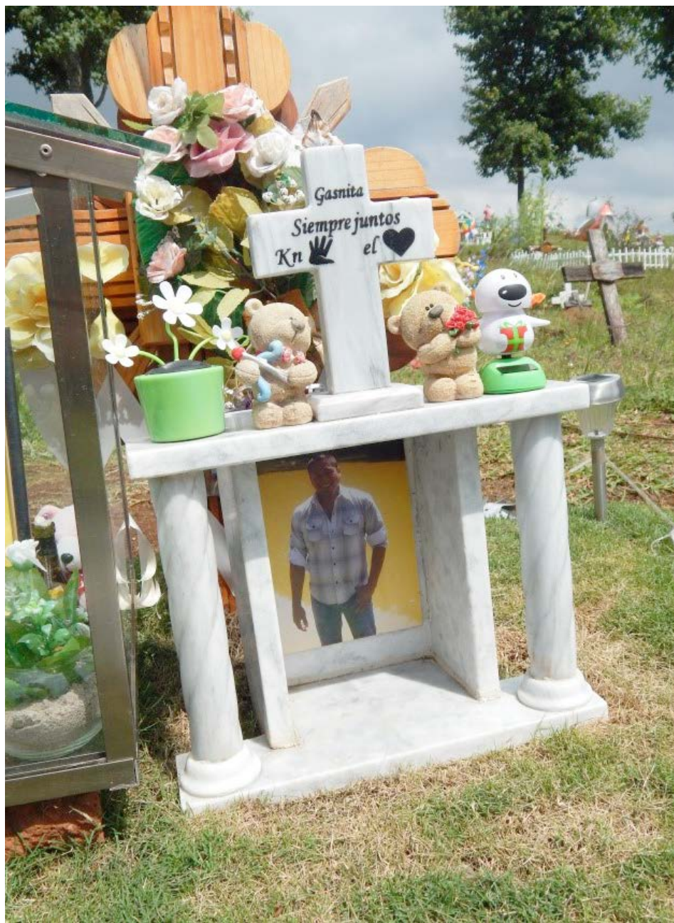
Figura 11 Caso 3