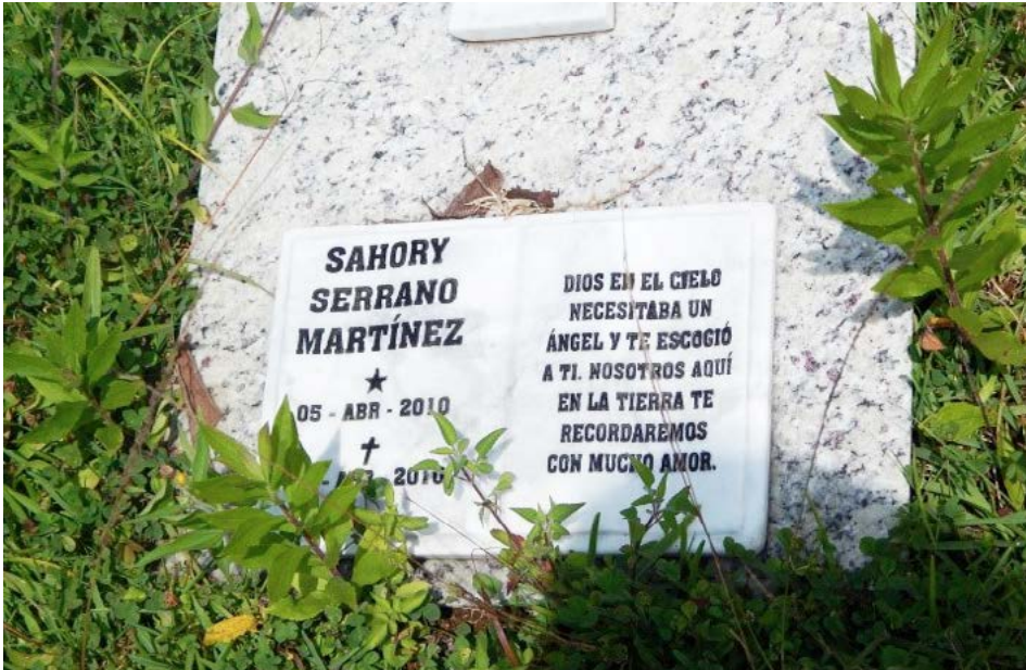
Figura 18 Caso 5