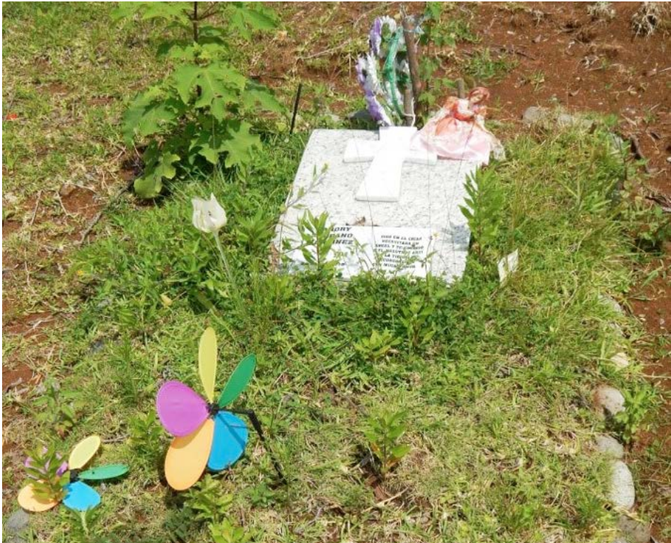
Figura 16 Caso 5

Relación de objetos en la tumba (seis en total):