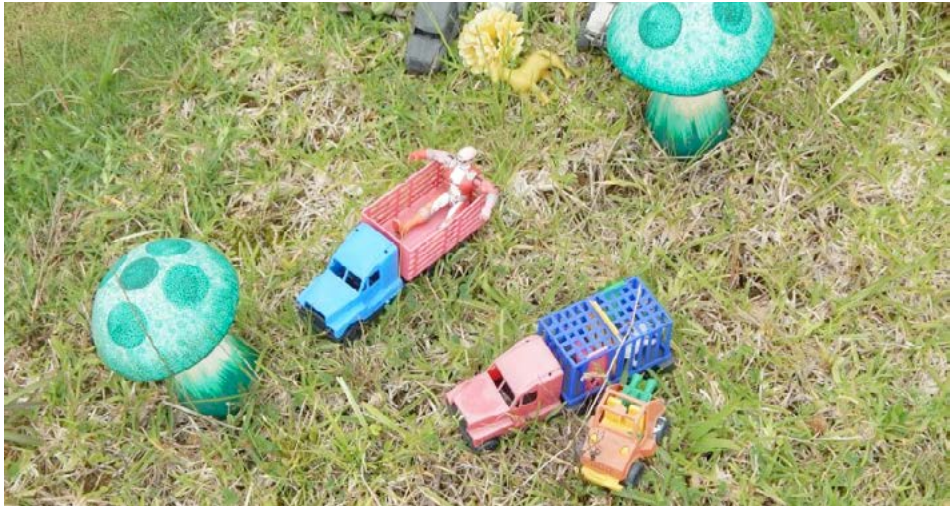
Figura 13 Caso 4